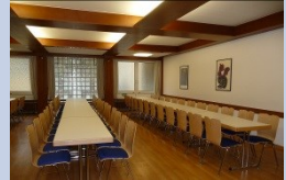
Evang. Gemeindehaus - Kleiner Saal - ca. 60 Personen