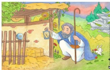
Illustration Sonja Häusl-Vad

Prot. Kirchengemeinde Kerzenheim lädt ein zum Kindertag