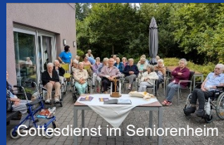
Gottesdienst im Seniorenheim