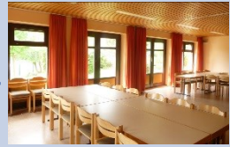
Haus der Kirche - ca. 40 Personen