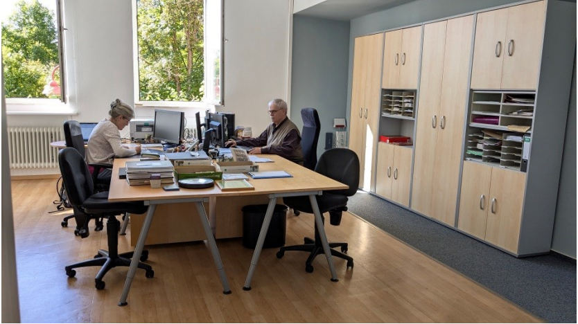
Neues Gemeindebüro im Evangelischen Gemeindehaus