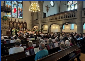
Gottesdienst - Kita-Jubiläum

aktiv daran mitzuwirken. Ihre Spende trägt dazu bei, dass unsere Kirche weiterhin ein Ort der Gemeinschaft, des Glaubens und der Hoffnung bleibt.