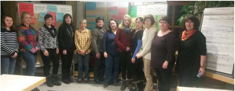
Teilnehmerinnen am Coaching-Treffen „Kita ist besser“ am 27.01. in Stauf Optimierung im Bereich Verpflegung für unsere Kinder in der Kita